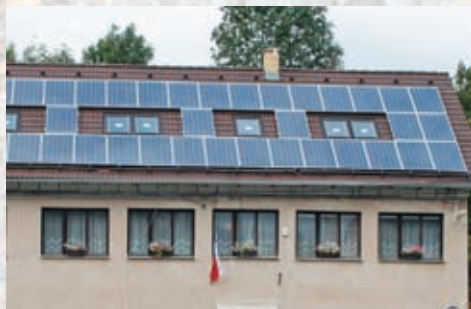
Výrobu čisté elektřiny pomocí dvou fotovoltaických panelů v Ohrobcí umožnili Prátele přírody, o.p.s.

Podtisk: Protihlukovou stěnu na Střelkové postupně zarůstají popínavky zasazené Prátele přírody.