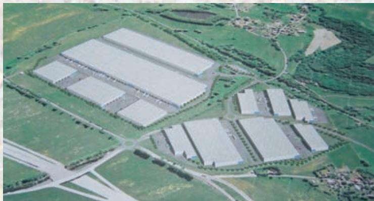
CPI park Žďárek

A do třetice se zdá, že jsme uspěli v případě plánu na „zónu“ u Petrovic v Krušných horách, která měla pro změnu nahradit mladý les. Investor podle našich informací svůj návrh – alespoň v původním rozsahu 23 ha – prý stáhl.