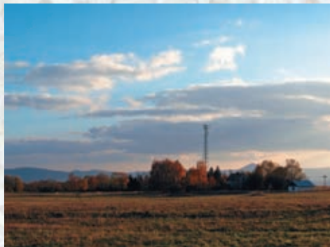
Žďárek, místo, které má smůlu.

Prátele přírody, o.p.s. V Podhájí 35 400 01 Ústí nad Labem www.Prateleprirody.cz pratele.prirody@seznam.cz IČ 27 26 14 17