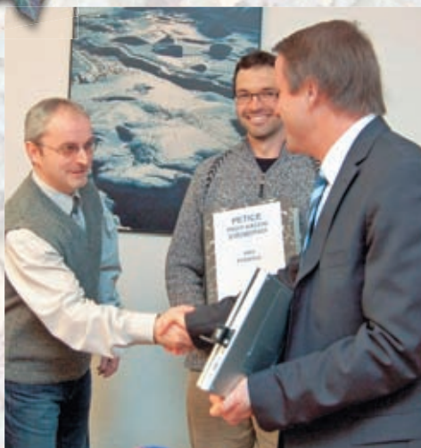
Setkání s ministrem životního prostředí s peticí Stop kácení alejí.